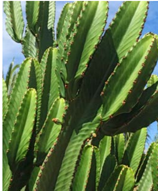
De cactus Cereus Peruvianus is een veel voorkomende plant op Lanzarote.