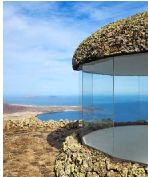
Mirador Cesar Manrique, uitkijktoren met uitzicht op de oostkust van het eiland en het naburige eilandje La Graciosa.