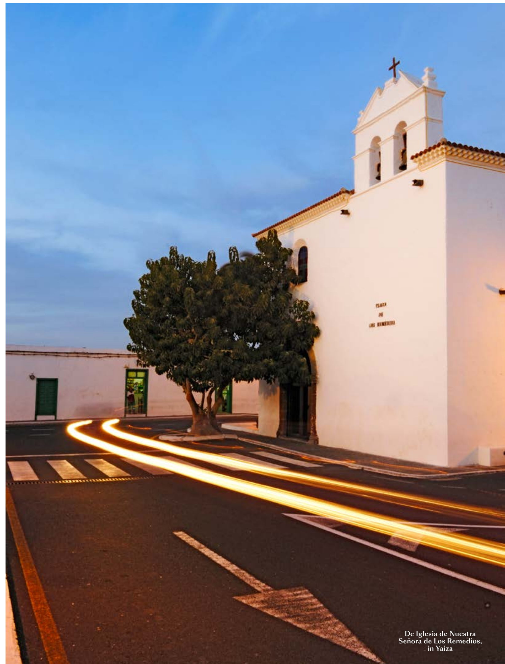
De Iglesia de Nuestra Señora de Los Remedios, in Yaiza

Jetairfly brengt je naar Lanzarote in 3u45 vanaf € 79. WWW.JETAIRFLY.COM