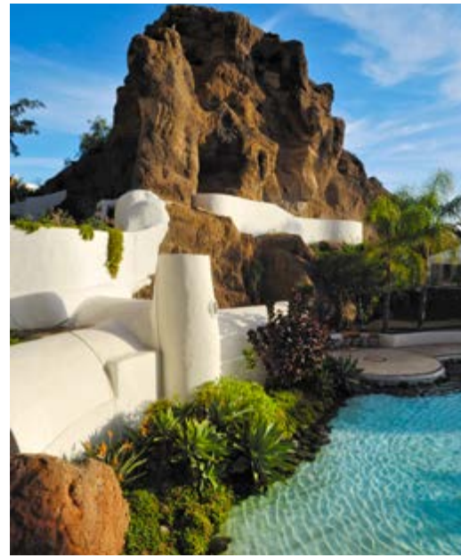
Lagomar, restaurant en nachtclub in een spelonk in de rotsen, en vroegere villa van Omar Sharif.