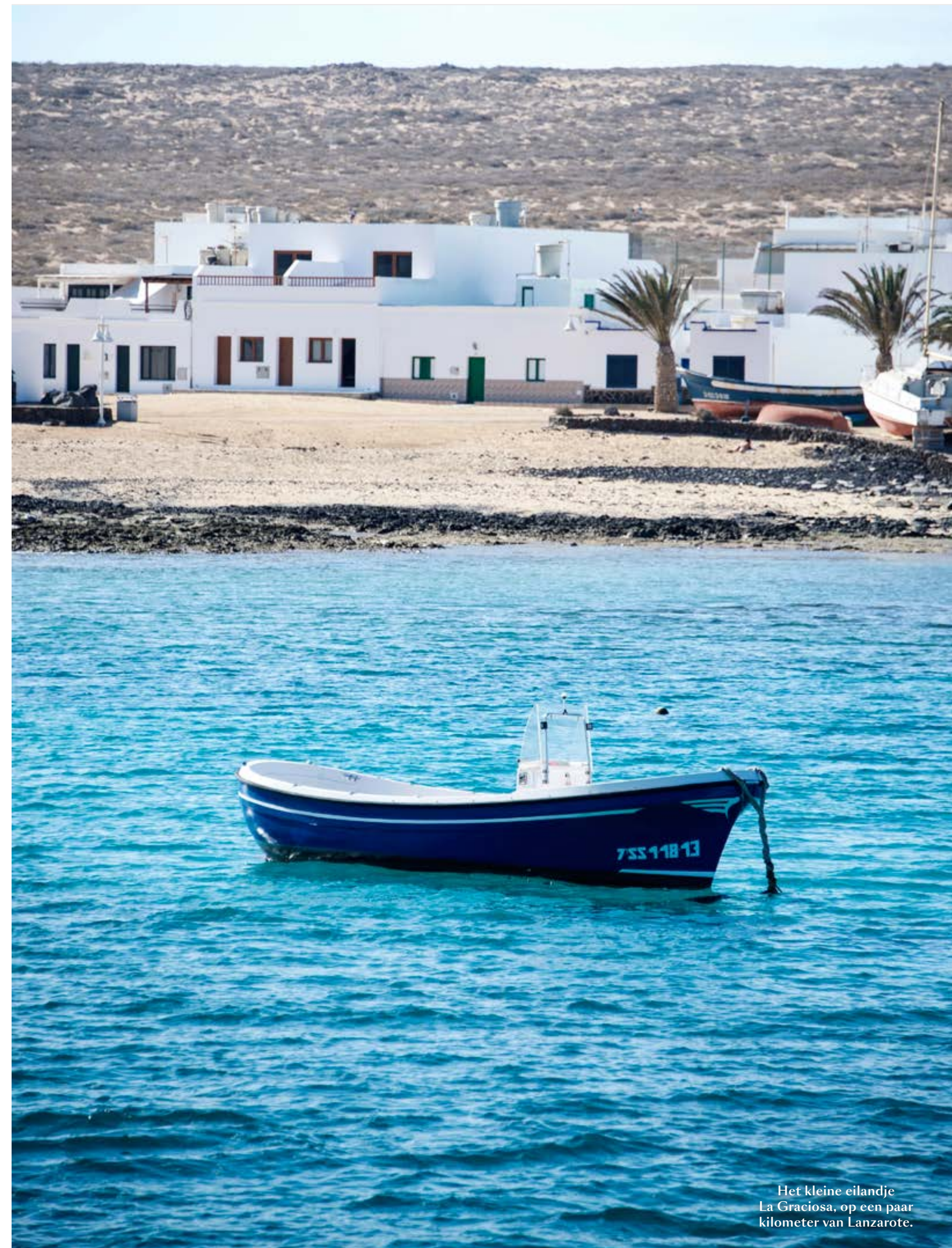
Het kleine eilandje La Graciosa, op een paar kilometer van Lanzarote.

Door PAUL JAMBERS.