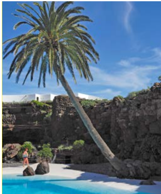
Jameos del Agua is een door Manrique ontworpen zwembad. Je kunt er ook lavatunnels bezoeken.