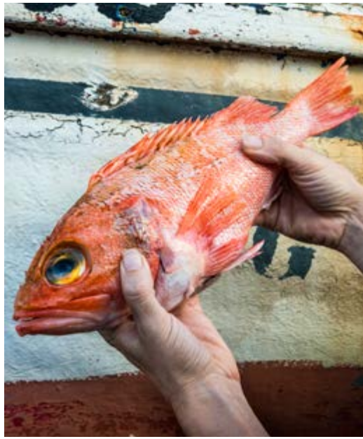
Boca Negra, een mooie roze vis die vaak in typische restaurants wordt geserveerd.