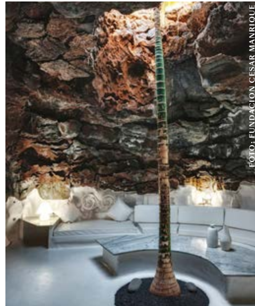
Het volledig in de rotsen ingewerkte huis van Manrique is nu een museum.