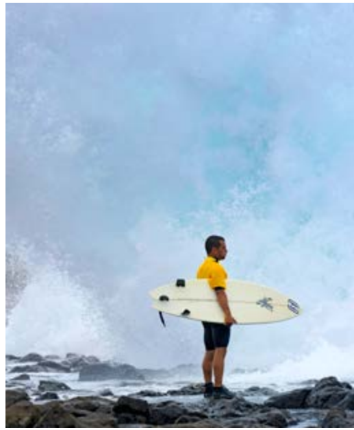
Famara, paradijs voor surfers en kitters.