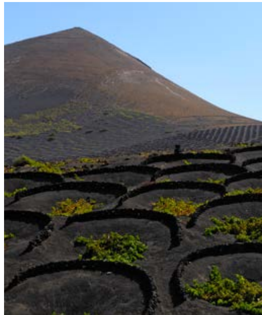
De wijngaard van La Geria. Rond elke wijnrank is er een muurtje gebouwd tegen de wind.