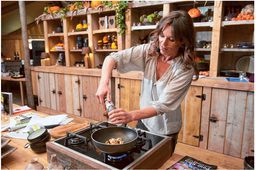
Boeken, servies, olijfolie: alles waar Pascale Naessens haar naam aan verbindt, verkoopt als zoete broodjes. Geen sprake van commercie, volgens Naessens. “Ik doe alles uit passie. Mocht ik willen, dan was er nog veel meer op de markt.”

En nu breidt ze haar imperium dus nog uit. Met het Kempense bedrijf Mintjens brengt ze meubels op de markt. “Tafels, een wandkast, wandrekken, bijzettafeltjes en dienborden”, vertelt bedrijfsleider